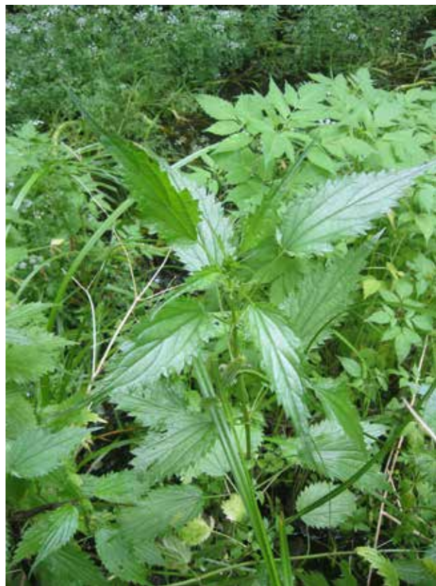
Рис. 2. Зовнішній вигляд Urtica kioviensis . Полтавська обл.

Urtica kioviensis – мезогідрофіт, надає перевагу вологим, багатим на поживні речовини та