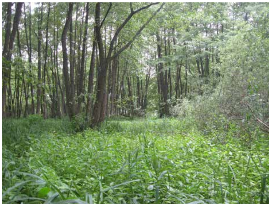
Рис. 3. Оселище, в якому виявлено Urtica kioviensis (Полтавська обл., 2018)

Згідно з нашими дослідженнями всі виявлені локалітети були розподілені між двома групами (табл. 1). Перша з них, представлена 5 геоботанічними описами з участю Urtica kioviensis , ідентифі-