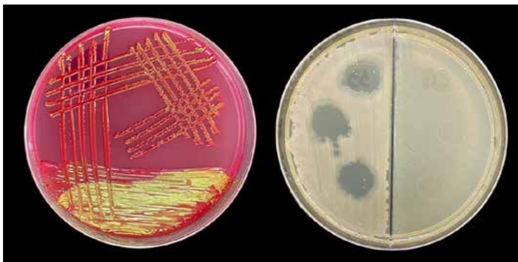
Рис. 3. Дослідження чутливості клінічних ізолятів Klebsiella pneumoniae до специфічного бактеріофагу

* S – чутливий, I – чутливий при збільшеній експозиції, R – резистентний