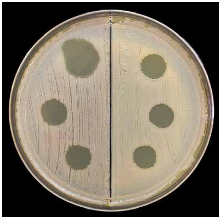
Рис. 1. Дослідження чутливості клінічних ізолятів Staphylococcus aureus до специфічного бактеріофагу