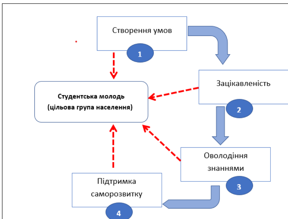
Рис. 1. Функціональна модель ключових аспектів мотивації студентської молоді до формування власного здорового режиму харчування [10]

тільки в шкільній програмі на заняттях валеології або основ здоров'я, які містять не достатньо необхідної інформації. Так, індикаторами інформаційного внеску можуть виступити наявність спеціалізованих факультативів, які будуть включені в програму навчання, з вимогою проходження і отримання сертифікату про оволодіння знаннями; наукові гуртки; відкриті лекції з запрошеними авторитетними спікерами; наочна інформація у будь-якому її прояві (стенди, інформаційних бюлетенів, тематичні плакати та інше).