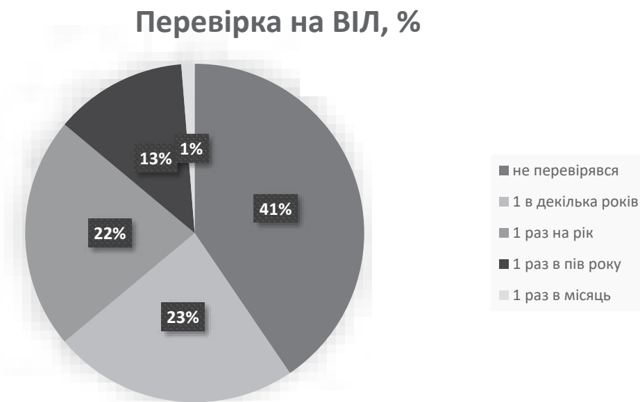
Рис. 2. Порівняльна кругова діаграма серед опитуваних, щодо їх перевірки на ВІЛ

вони на ПСШ, то 152 студенти (96,2%) відповіли ні, і 6 (3,8%) вказали, що так.