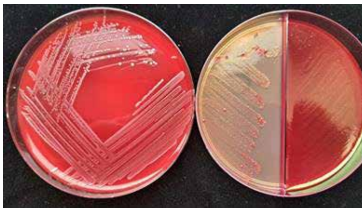
Рис. 1. Чиста культура Enterococcus faecalis ізольована із осередку запального процесу порожнини рота

В результаті проведених досліджень нами було ізольовано 74 культури бактерій роду Enterococcus , 34 культури, з яких належали до виду Enterococcus faecalis та 40 – до Enterococcus faecium .